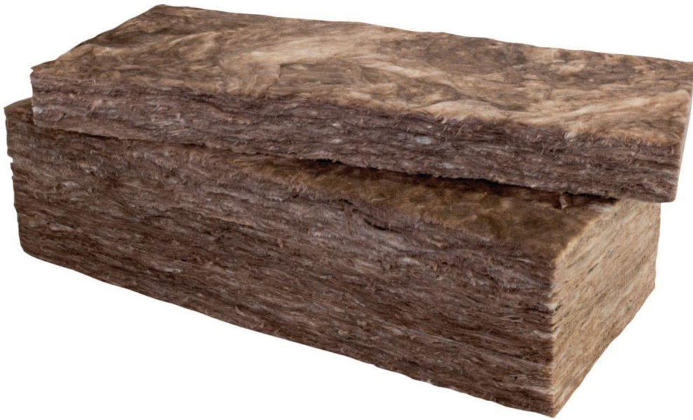
Knauf Insulation laine de verre ECOSE® TP 138 60 mm