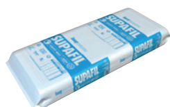
SUPAFIL CAVITY WALL