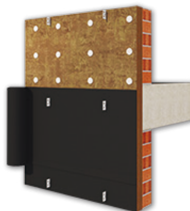
Sistema Rainproof - Fachada ventilada

Knauf Insulation, S.L Polígono Can Calderón Avda. de la Marina, 54 08830 Sant Boi del Llobregat (BCN) Tel.: + 34 93 379 65 08 hola@knaufinsulation.com www.knaufinsulation.es