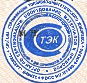
Схема сертификации 1