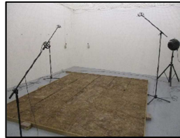
Coefficiente absorción acústica, \alpha_s

Fecha de ensayo: 14 de septiembre de 2017